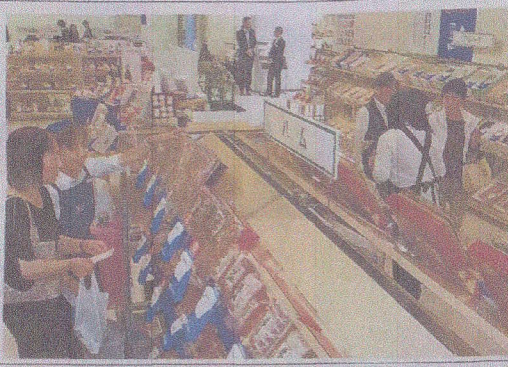
岡山県内の百貨店のトップを切り、天満屋丸山(岡山市北区表町)と岡山高島屋(同)を展示、同社が厳選した地元産品をPR。

岡山県内の百貨店のトップを切り、天満屋、丸山(岡山市北区表町)と岡山高島屋(同)を展示、同社が厳選した地元産品をPR。中元商戦は約2千点、約2千点を展示、同社が厳選した地元産品をPR。中元商戦は約2千点、約2千点を展示、同社が厳選した地元産品をPR。