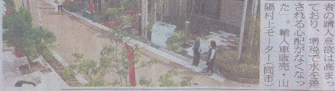
岡山市内の住宅展示場。増税延期を追い風ととらえる企業も

岡山県は4月に発表された三菱自動車燃費不正問題で、総社市の片岡除一市長は1日、岡山県庁で伊原木隆太郎と面談し、水島製作所の軽自動車生産停止の影響を受けている地元部品メーカーへの支援などで県の協力を求めた。(13面関連)