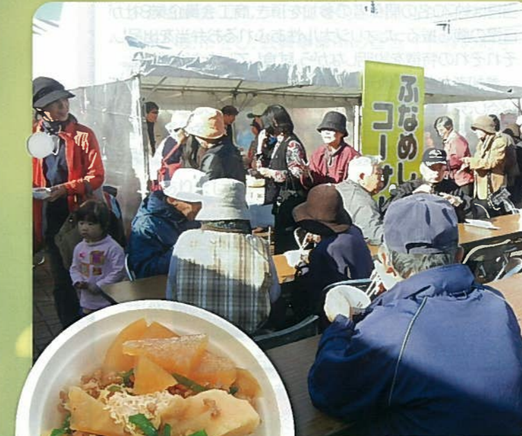
ふるさとふれあい商まつり

すなわち、考えるプロセスにおいては網羅的に、実行する段階では優先順位をつけることが、企業経営においては不可欠です。